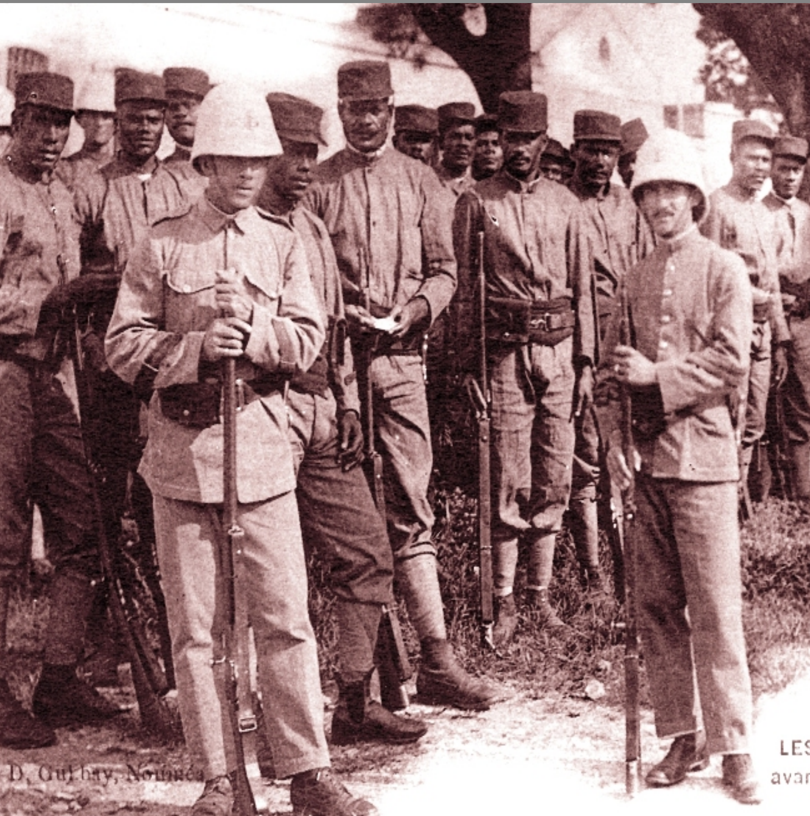
D. Guj hay, Nouméa